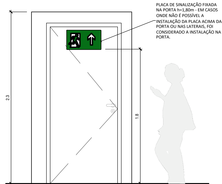
03 VISTA - CIRCULAÇÃO DIREÇÃO ESCALA 1/25

Importante: 1- VER POSICIONAMENTO EXATO DE CADA PLACA NO PROJETO COMPLEMENTAR DE PREVENÇÃO A INCÊNDIO.